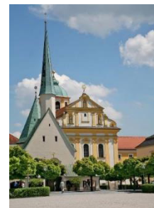
Wallfahrtskapelle Altötting, (W. Bulach via Wikimedia)

Es stehen uns 42 Plätze zur Verfügung. Wer Interesse an dieser Reise hat, meldet sich bitte bis zum 01.05.2023 im Pfarrbüro Eisenach an.