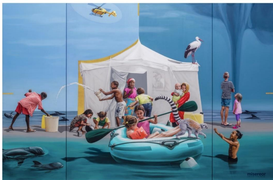
Das Misereor-Hungertuch 2025/2026 „Liebe sei Tat“ von Konstanze Trommer

Zum Abschluss ist wieder ein gemeinsames Picknick geplant, zu dem jeder etwas mitbringt.